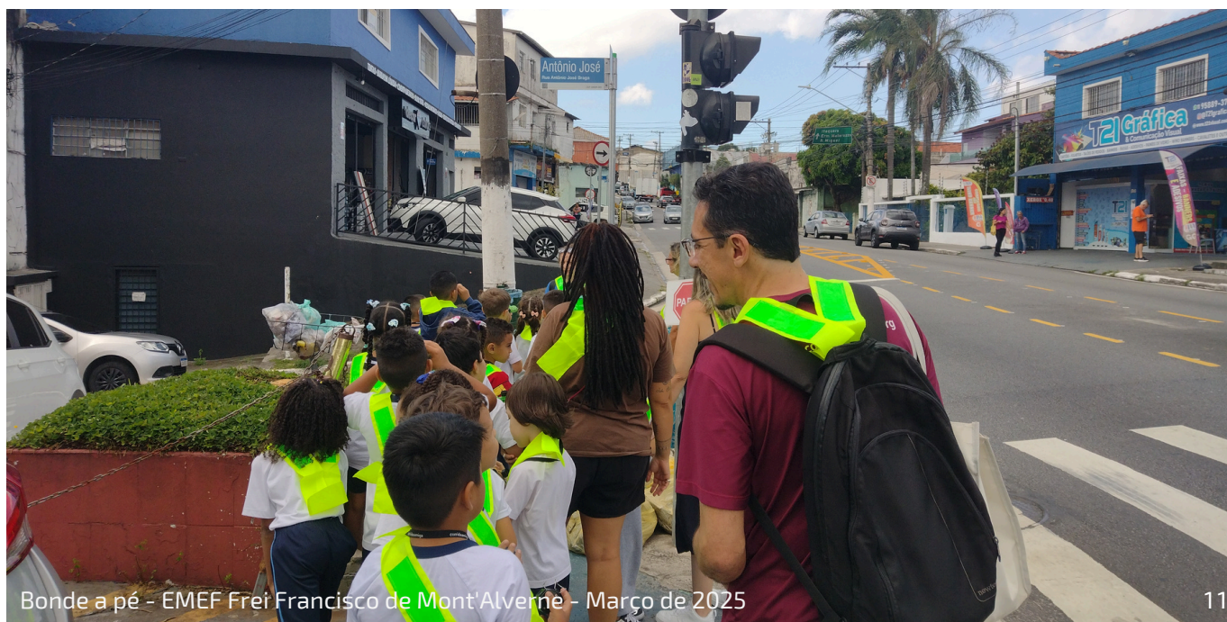
Bonde a pé - EMEF Frei Francisco de Mont'Alverne - Março de 2025