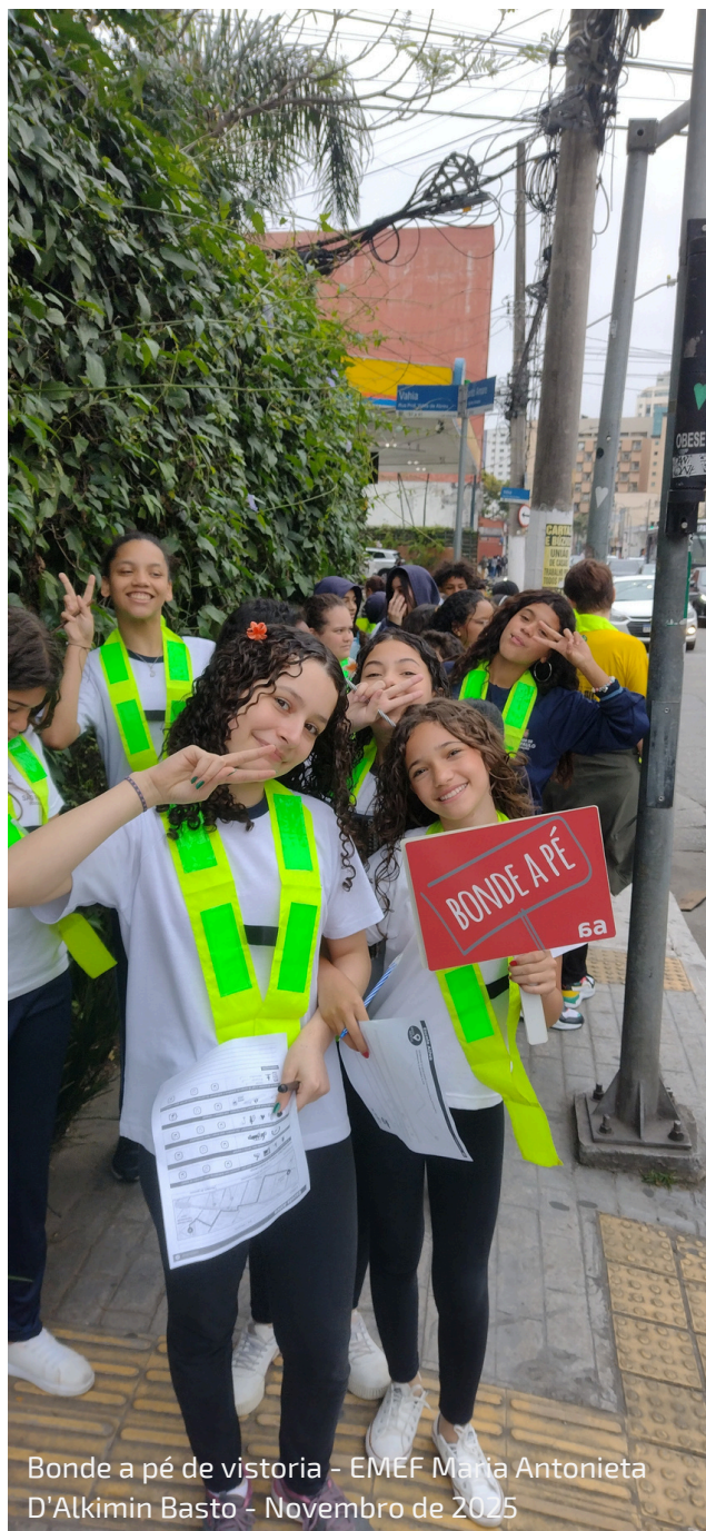
Bonde a pé de vitória - EMEF Maria Antonieta D'Alkimin Basto - Novembro de 2025

(25-27) LIE 4 (LEI DE INCENTIVO AO ESPORTE) MINISTÉRIO DO ESPORTE