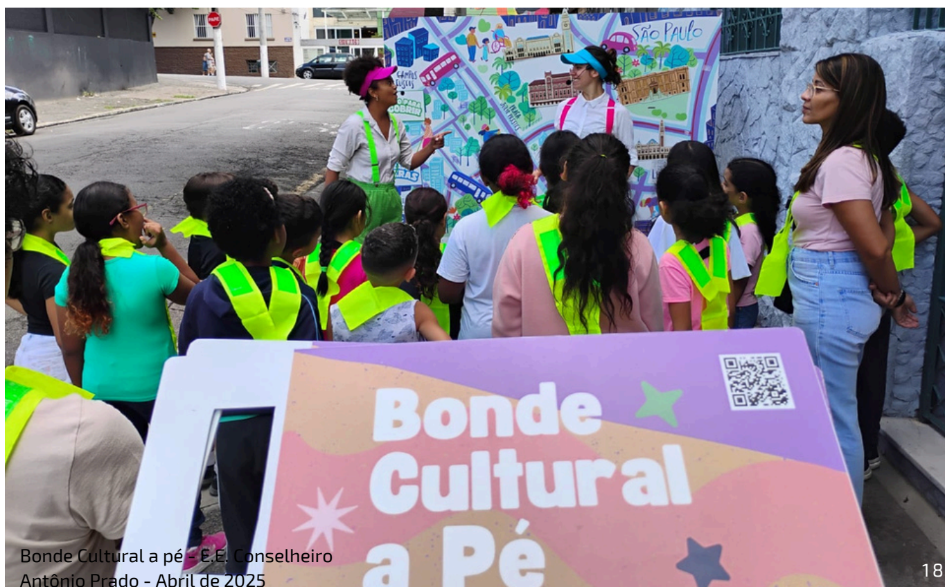
Bonde Cultural a pé - E.E. Conselheiro Antônio Prado - Abril de 2025