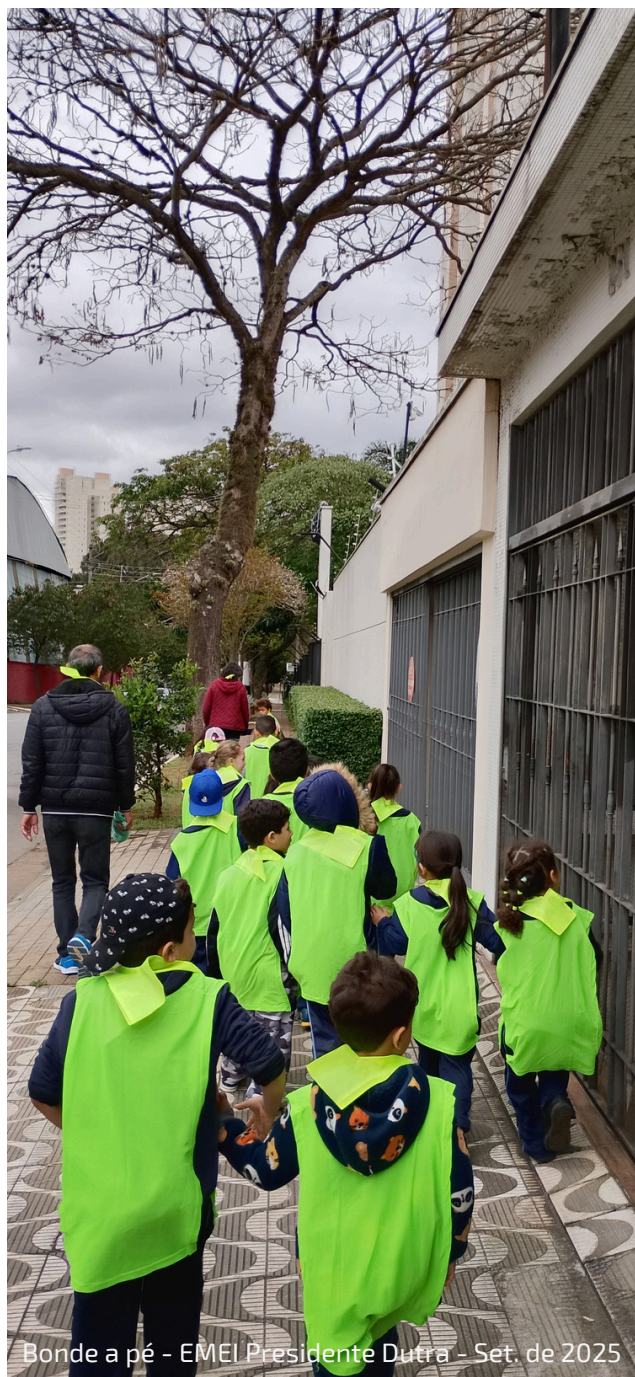
Bonde a pé - EMEI Presidente Dutra - Set. de 2025

(25-27) LIE 4 (LEI DE INCENTIVO AO ESPORTE) MINISTÉRIO DO ESPORTE