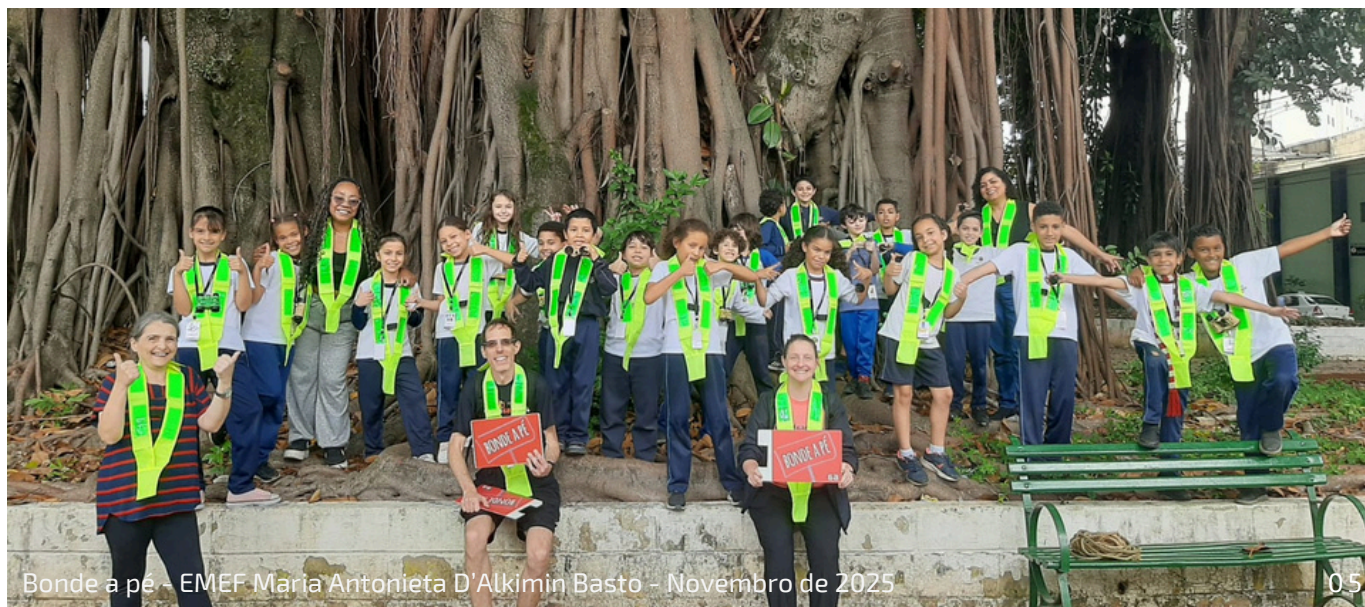
Bonde a pé - EMEF Maria Antonieta D'Alkímin Basto - Novembro de 2025