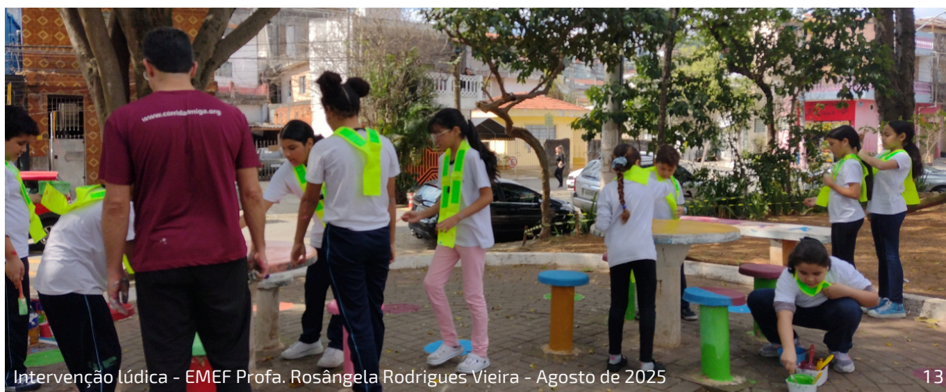
Intervenção lúdica - EMEF Profa. Rosângela Rodrigues Vieira - Agosto de 2025

Através de encontros formativos com educadores e atividades lúdico-educacionais com crianças e adolescentes, o projeto visa sensibilizar, desenvolver capacidades e mobilizar comunidades do território de Vila Cisneros e Ermelino Matarazzo, entre as cidades de São Paulo e Guarulhos, sobre o papel da mobilidade urbana no pertencimento e direito à cidade de crianças e adolescentes.