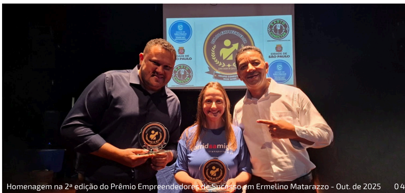
Homenagem na 2ª edição do Prêmio Empreendedores de Sucesso em Ermelino Matarazzo - Out. de 2025