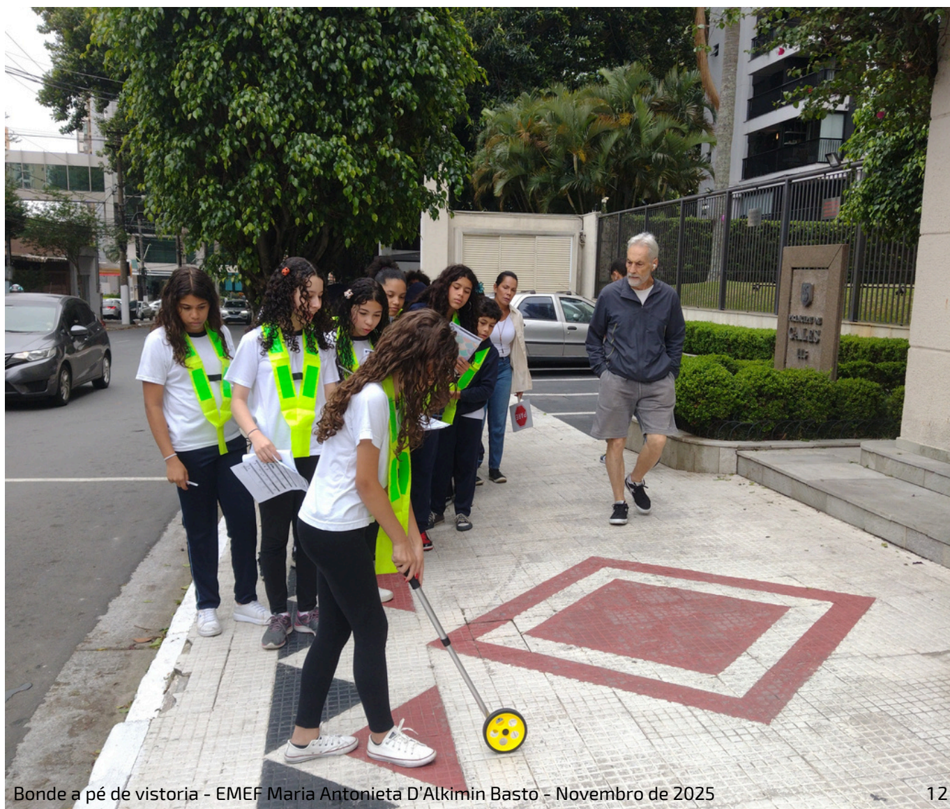
Bonde a pé de vistoria - EMEF Maria Antonieta D'Alkimin Basto - Novembro de 2025

A seguir, destacamos os projetos que foram realizados em 2025.