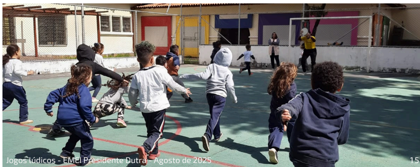
Jogos lúdicos - EMEI Presidente Dutra - Agosto de 2025

Em 2025, o projeto beneficiou duas escolas: a EMEI Presidente Dutra, no Tatuapé, e a EMEF Maria Antonieta D'Alkimin Basto, na Vila Olímpia.