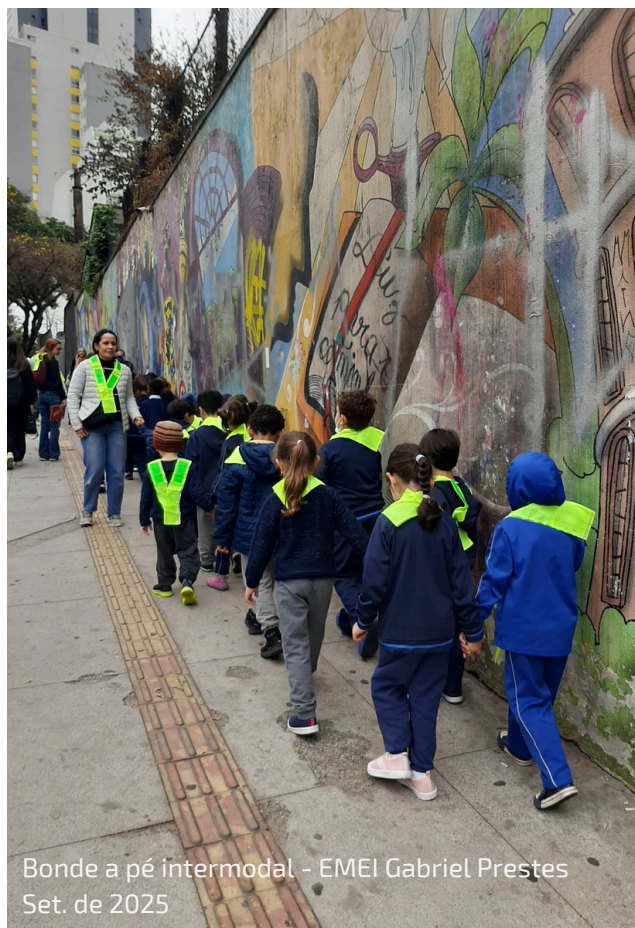
Bonde a pé intermodal - EMEI Gabriel Prestes Set. de 2025