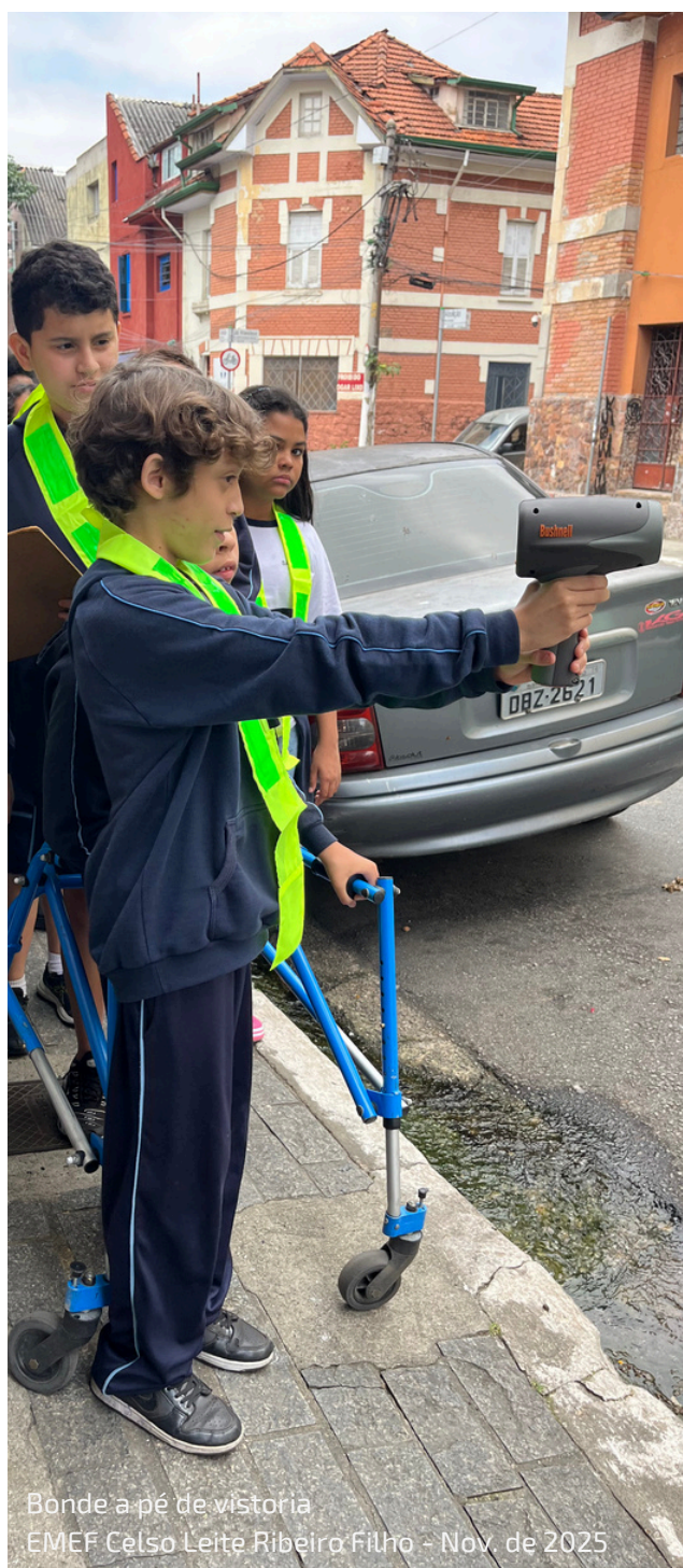
Bonde a pé de vitória EMEF Celso Leite Ribeiro Filho - Nov. de 2025

2025 foi um ano de celebração pelas conquistas alcançadas por meio de nossos projetos institucionais e de nossas ações de voluntariado, que ampliam o alcance de nossas iniciativas e reafirmam nosso propósito de engajamento cívico, político e de cidadania.