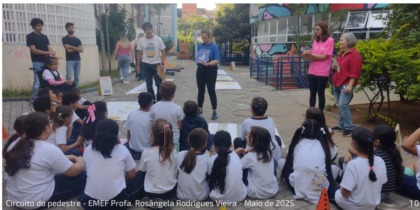
Circuito do pedestre - EMEF Profa. Rosângela Rodrigues Vieira - Maio de 2025