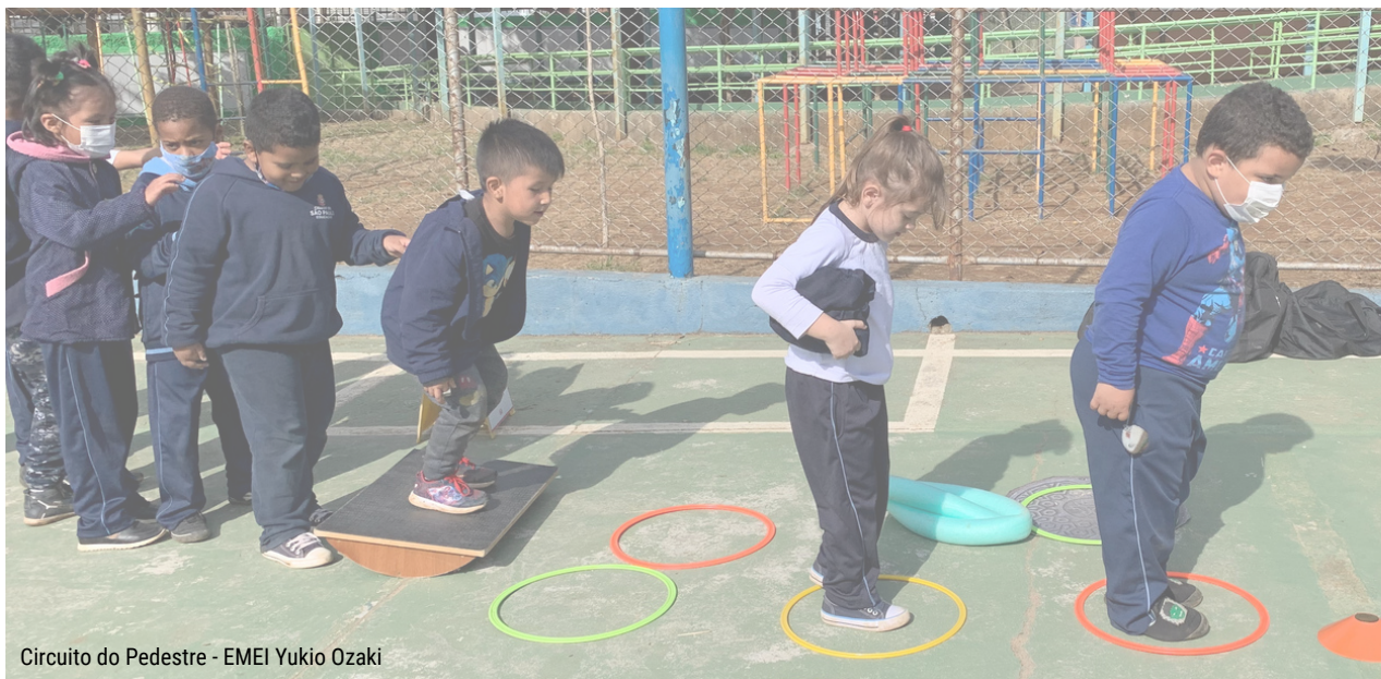
Circuito do Pedestre - EMEI Yukio Ozaki

A partir de um circuito interativo, a atividade tem como objetivo simular as mais variadas situações da rede de mobilidade urbana a pé. Nessa atividade, dinâmicas lúdicas e divertidas buscam estimular o caminhar e correr nas cidades e os/as participantes absorvem e aprendem conceitos de mobilidade, transporte a pé, acessibilidade e cidadania. Veja a atividade completa na cartilha de Práticas Pedagógicas (página 27).