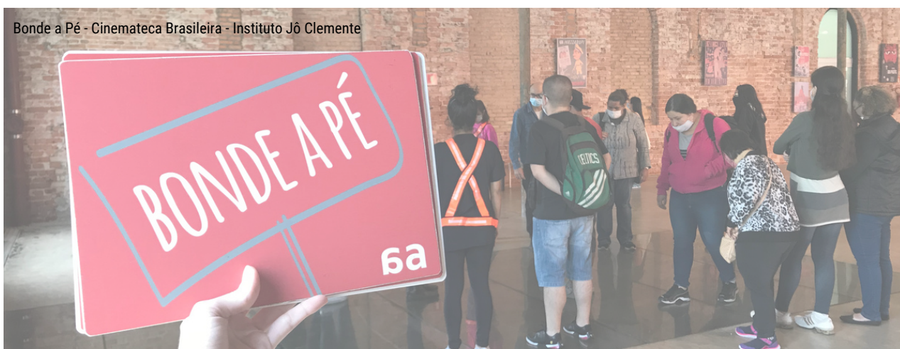
Bonde a Pé - Cinemateca Brasileira - Instituto Jô Clemente

Por meio de uma caminhada guiada, a atividade busca promover a atividade física e estimular um olhar atento e crítico, provocando a reflexão sobre como é possível melhorar as condições do caminho em nossos deslocamentos, identificando as características das calçadas, da iluminação, do descarte de lixo e das travessias. Veja a atividade completa na cartilha de Práticas Pedagógicas (página 41).