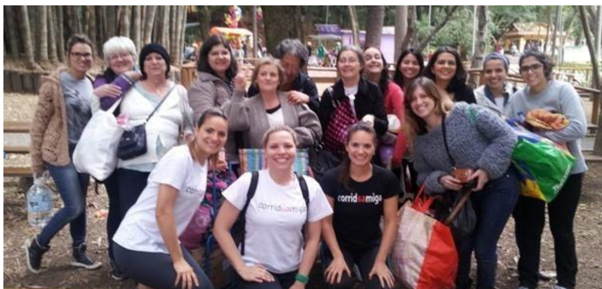
Grupo participa do Dia de Correr para o Trabalho, em SP.

Postado em: 11 de junho de 2014